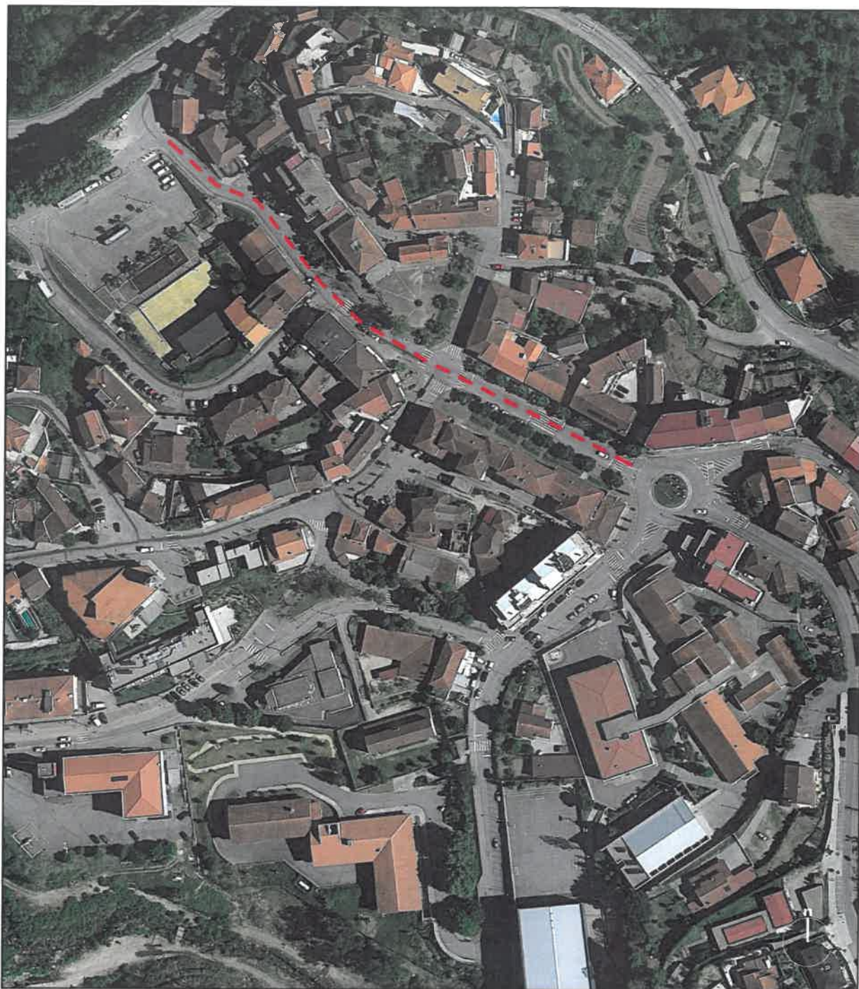
Extrato do Google Earth (s/escala)